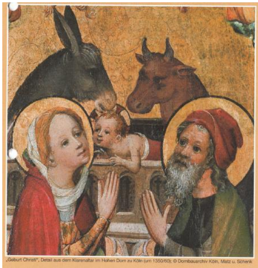
„Geburt Christi“, Detail aus dem Klarenaltar im Hohen Dom zu Köln (um 1350/60); © Dombauarchiv Köln, Matz u. Schenk