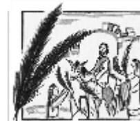
„Im Schatten des Jubels“

„Er sagte zu ihnen: Geht in das Dorf, das vor euch liegt; gleich wenn ihr hineinkommt, werdet ihr einen jungen Esel angebunden finden, auf dem noch nie ein Mensch gesessen hat. Bindet ihn los, und bringt ihn her! Und wenn jemand zu euch sagt: Was tut ihr da?, dann antwortet: Der Herr braucht ihn; er lässt ihn bald wieder zurückbringen.“