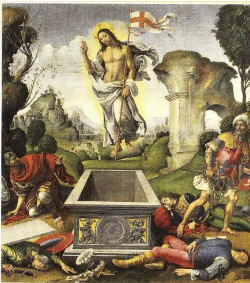
Raffaellino del Garbo, Auferstehung Jesu, Galleria dell'Accademia, Florenz; Foto © bpk/Scala