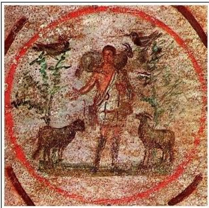
Christus als der Gute Hirte (Priscilla-Katakombe - Rom)

Wer bei einem Besuch in Rom die berühmten Katakomben besichtigt, kann dort die erste und älteste christliche Darstellung von Jesus finden. Es ist kein Bild von Jesus am Kreuz, sondern von Jesus als Römer mit einer Toga bekleidet und ein Lamm über den Schultern: Jesus der gute Hirte.