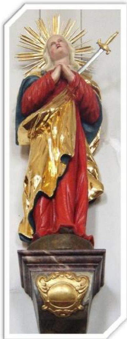
Bild: Schmerzensmutter auf der Nordseite der Pfarrkirche Ergoldsbach

Das Fest „Darstellung des Herrn“ heißt im Volksmund „Maria Lichtmess“. Simeon erkennt in Jesus das Licht der Welt, noch einmal erstrahlt weihnachtlicher Glanz. Doch die Worte des Simeon an Maria werfen auch einen Schatten – gerade auf die Mutter. Sie lässt für einen Moment das Kind los und legt es in die Hände eines wildfremden Menschen. Sie gibt das Kind kurz frei. Denn ihr Kind ist nicht ihr Privatbesitz. Ihr Kind kommt nicht allein aus ihr. Sie kann – wie so oft im Leben – nur dabeistehen, ganz nahe, und muss zuschauen, welchen irdischen Weg ihr Kind nimmt. Ein irdischer Weg, der auch für die Mutter voller Schmerzen ist.