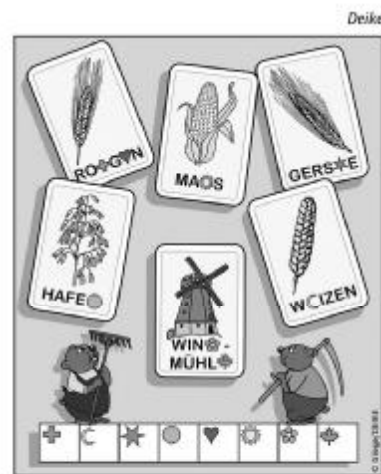
Jeder fehlende Buchstabe wird durch ein Symbol ersetzt. Trage die Buchstaben in die jeweiligen Lösungskästchen ein, und du erhältst das Lösungswort.