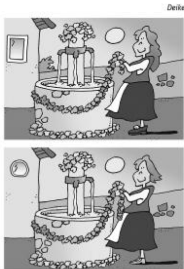
Finde die 8 Fehler im unteren Bild!