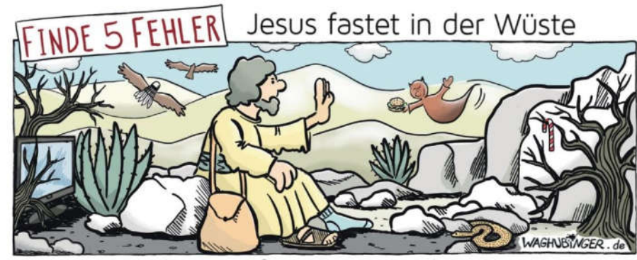
Fernseher, Fernseher, Federball, Socke, Hamburger, Zuckerstange

erzählt die Bibel. Als Jesus erwachsen war und den Menschen von Gott erzählen wollte, ging er vorher in die Wüste. Die Wüste ist zum Leben kein guter Raum: am Tag heiß, in der Nacht kalt, wenig zum Trinken, nichts zum Essen. Aber auch keine Ablenkung. Wohin man schaut, nur Sand und Steine. Jesus ging in die Wüste, um sich ganz auf Gott zu konzentrieren, nichts sollte ihn ablenken, nicht einmal etwas zu essen. Wir hier bei uns haben keine Wüsten. Doch wir können auch dort, wo wir leben, versuchen, uns immer wieder auf Gott zu konzentrieren und uns nicht ablenken zu lassen. Und dabei hilft, auf etwas zu verzichten. Sozusagen Platz zu schaffen für Gott.