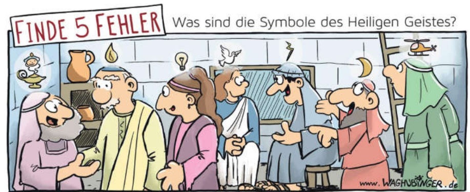
Flaschengeist, Glühbirne, Blitz, Mond, Hubschrauber