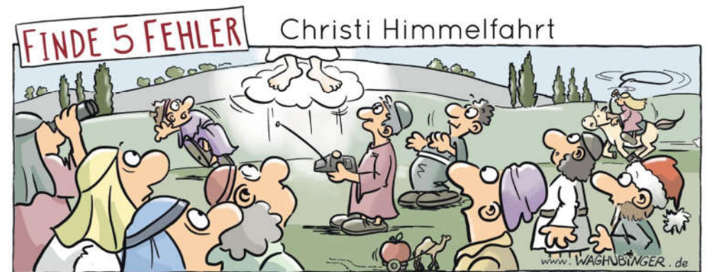
Fernglas, Fernsteuerung, Minikamel, Lasso, Nikolausmütze

Ja, weil Jesus zu seinem Vater zurückkehrt, darüber können wir uns mit ihm freuen. Und weil die Jünger trotzdem nicht alleingelassen werden. Das verspricht Jesus ihnen. Er wird immer bei ihnen sein. Und das verspricht er nicht nur den Jüngern vor fast 2.000 Jahren, sondern allen Menschen. Bis heute. Auch uns. Jesus ist immer bei uns, auch wenn wir ihn nicht sehen. Wir können mit ihm reden im Gebet. Wir können seine Nähe erfahren. Und er ist bei uns im Heiligen Geist. Da kam zu den Jüngern zehn Tage nach der Himmelfahrt an Pfingsten. Doch das ist eine andere Geschichte, und die erzähle ich euch das nächste Mal.