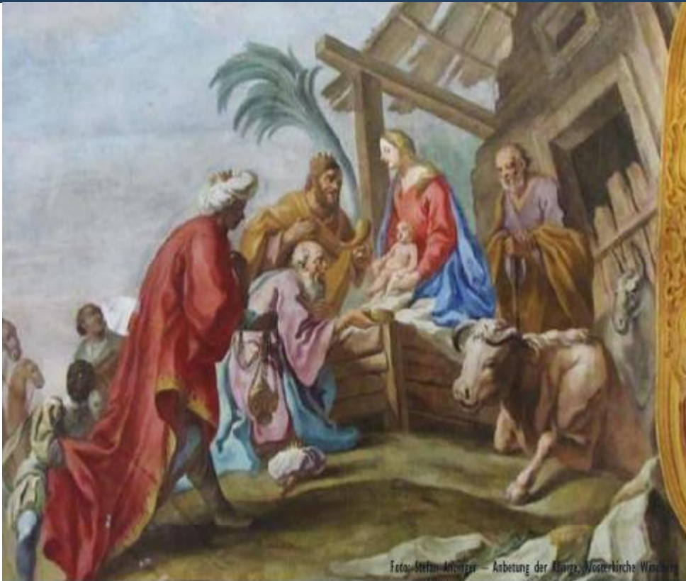
Foto: Stefan Anzinger – Anbetung der Könige, Klosterkirche Walsertal