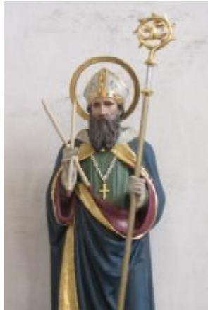
Wallfahrtskirche Bogenberg