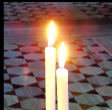
Und das ewige Licht leuchte ihnen!