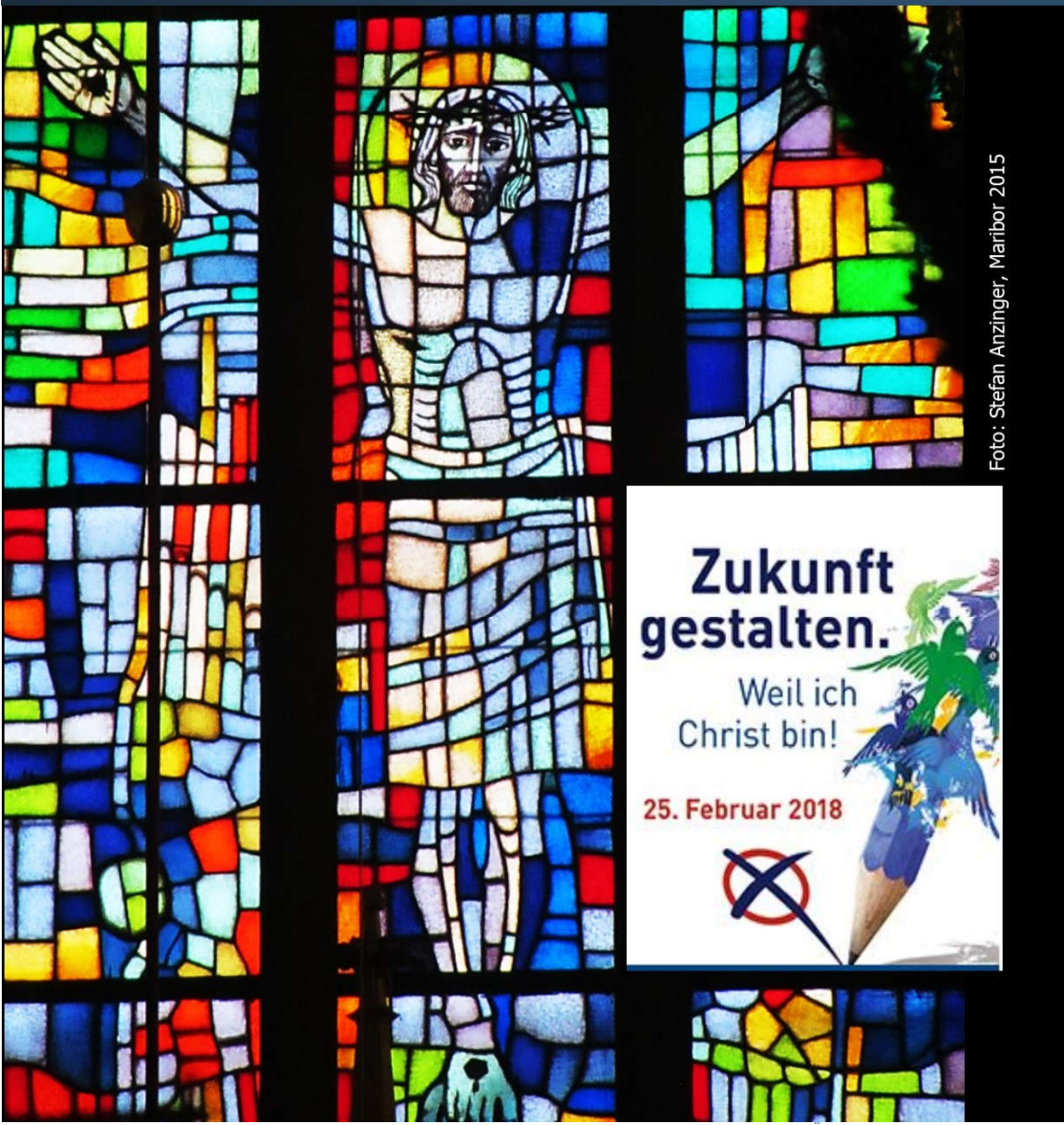
Maribor 2015