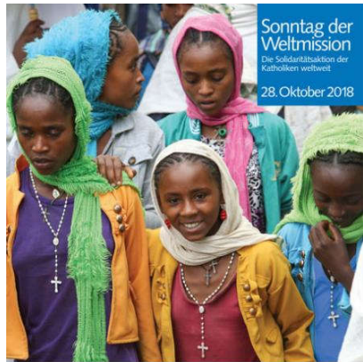
Sonntag der Weltmission Die Solidaritätsaktion der Katholiken weltweit 28. Oktober 2018