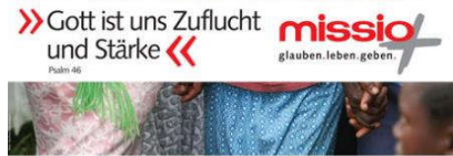
www.missio-hilft.de Danke für Ihre Spende!

„Gott ist uns Zuflucht und Stärke“ (Ps 46) lautet das Bibelzitat zum Weltmissionssonntag 2018, unter dem missio die Arbeit der katholischen Kirche in Äthiopien vorstellt. Nur 0,7 Prozent der Äthiopier sind Katholikinnen und Katholiken. Dennoch entfalten sie große Wirkung.