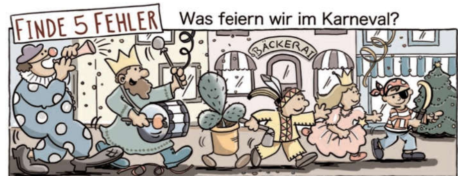
Apfel, Kakthus, Banane, BäckerAI, Weihnachtsbaum

viel verboten: Sie durften kein Fleisch essen (Karneval heißt übersetzt: Fleisch, lebe wohl), keinen Alkohol trinken und nicht feiern. Sechs Wochen lang. Und deshalb wurde vor dem Beginn der Fastenzeit noch einmal richtig gefeiert, gegessen und getrunken. Am Karneval. Da wollte man auch gerne in eine andere Rolle schlüpfen, jemand anderes sein. Und deshalb verkleidete man sich. Zum Beispiel als Bischof oder als König. Im Karneval war das erlaubt. Karneval und Fastenzeit gehören also ganz eng zusammen, doch viele wissen das heute leider nicht mehr. Sie feiern Karneval, doch an die Fastenzeit denken sie nicht. Das ist eigentlich schade.