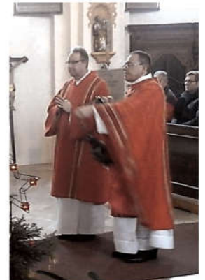
Text und Fotos: Margit Stempfhuber