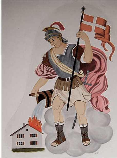
Foto: Stefan Anzinger: (Gemälde Hl. Florian Konrad Anzinger, Arth 2009)

Am 4. Mai gedenkt die Kirche des heiligen Florian , eines Offiziers der römischen Armee im oberösterreichischen Lorch. Weil er Christ ist, wird er vom Posten als Amtsvorsteher des Statthalters entlassen, weil er inhaftierten Christen hilft, wird er gefoltert und ertränkt. Aber sein Tod bewirkt nicht die Einschüchterung der Christen an Donau und Enns, sondern durch sein Zeugnis gibt er den Christen Lebenskraft über Jahrhunderte bis heute. Florian ist Patron der Feuerwehr und wird gegen Feuersnot angerufen. Gestorben ist er am 4. Mai 304.