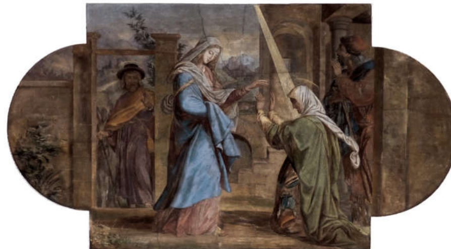
2. Juli Fest Mariä Heimsuchung: Ein Gnadengipfel im Bergland von Judäa. Elisabeth, an der Gott Wunderbares gewirkt hat, erkennt sein Wirken an Maria. Sie erwartet einen Sohn, Maria den Herrn. So wirkt die Gnade Gottes.