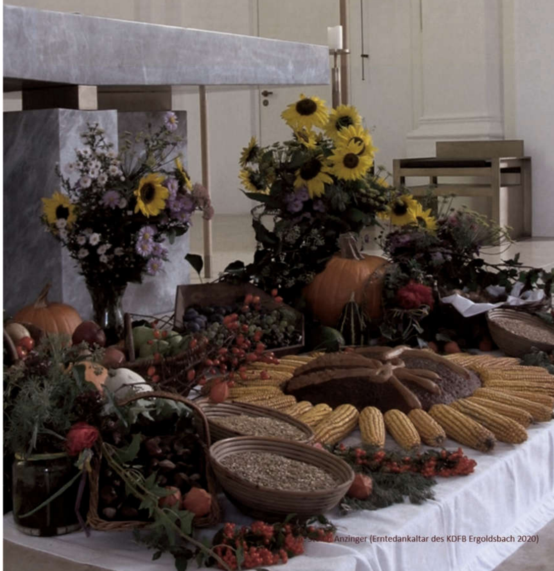
Erntedankfest Anzinger (Erntedankaltar des KDFB Ergoldsbach 2020)

Pfarrengemeinschaft Ergoldsbach – Bayerbrunn