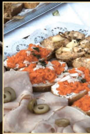
Neben gutem Wein gab es leckeres Fingerfood vom Gasthaus Pritscher