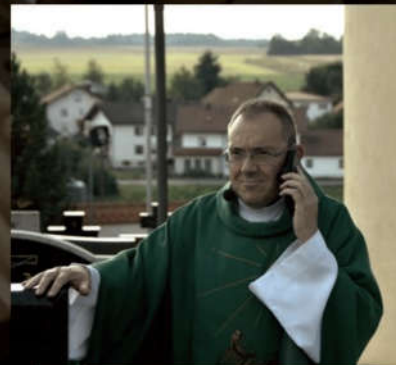
Wo bleiben denn die Bläser?