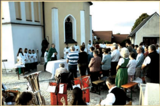
Bläser der Roßbachtaler Blasmusik spielten nicht nur beim Gottesdienst