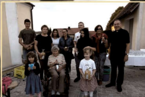
Für jeden gab es in Los und das sind die Gewinner