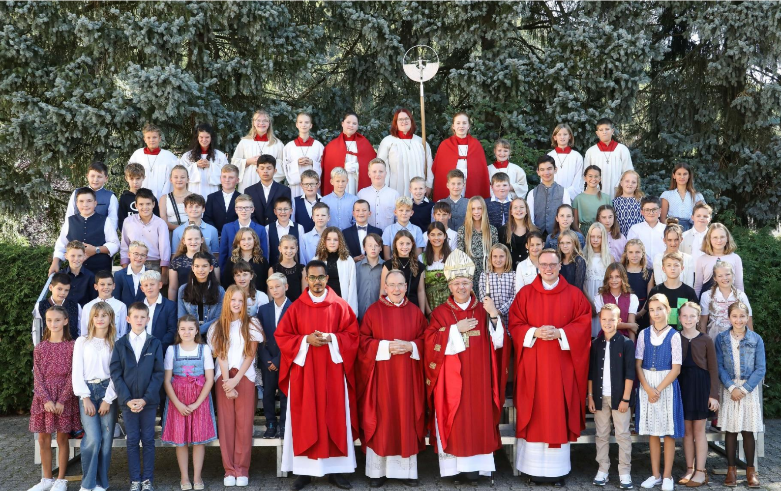
Firmung in Ergoldsbach am 16.09.2023