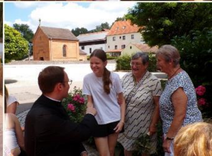
Verabschiedung Kaplan Preuß in Bayerbach